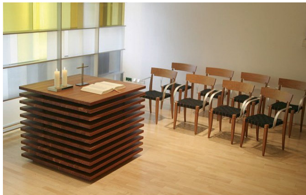
Andachtsraum der Universitäts-Frauenklinik Tübingen

Der Andachtsraum der Klinik auf Ebene 4 steht Ihnen jederzeit auch als Raum der Stille zur Verfügung.